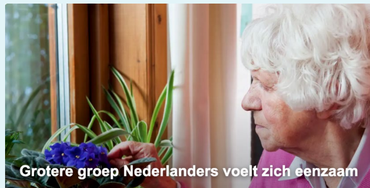
Grotere groep Nederlanders voelt zich eenzaam

– Een eerste val leidt vaak tot een cyclus van letsel, verminderde mobiliteit, sociaal isolement (eenzaamheid), verslechterde voedingsstatus en meer vallen.